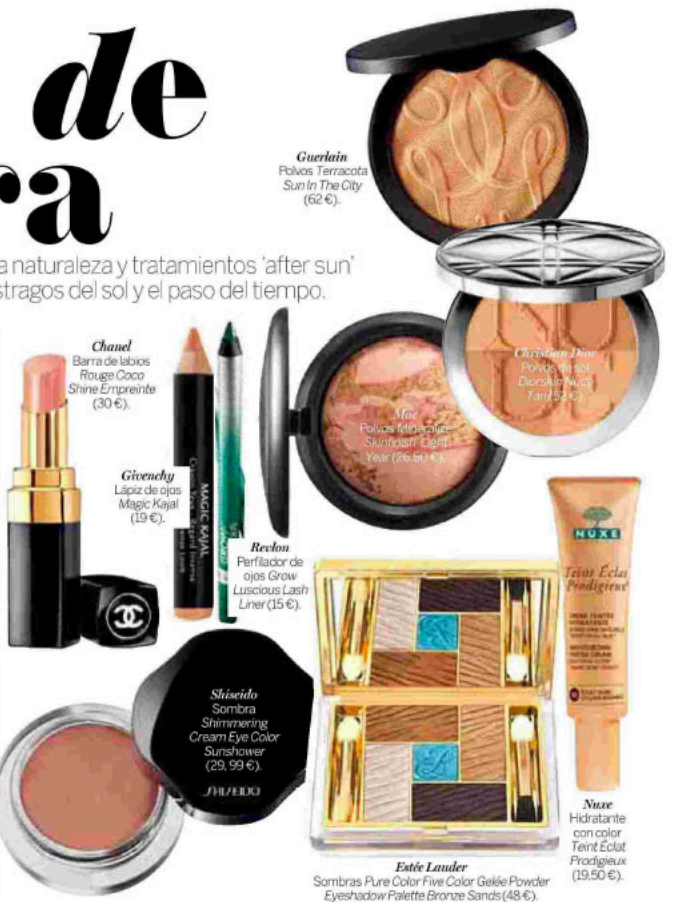
Chanel Barra de labios Rouge Coco Shine Empreinte (30 €).

Oigo Clínica Planas y me viene a la cabeza el antiaging que sigue el Rey en las instalaciones de Barcelona. El lugar a donde acude el jefe del Estado a recibir sus tratamientos ha tenido que ser testado, revisado y mirado con lupa. También da confianza saber que el jefe del departamento de láser, el doctor Serena, lleva 18 años especializado en su uso. El año pasado realizó más de 5.000 tratamientos, y en todos siempre hay tres preguntas: ¿cuánto tiempo estaré de baja?, ¿cuánto cuesta? y ¿doctor, duele? En el caso del láser Erbium (YAG Burane combinado con la infiltración de toxina botulínica-botox-), lo último para el tratamiento de las arrugas faciales, la baja es de dos a tres semanas, el precio entre 1.200 y 1.500 euros y el dolor inapreciable. Tras anestesiar la zona, se pasa el láser por las partes a tratar: arrugas, rojeces, manchas... Sobre la piel, se forma una costra que se cae a los siete o 12 días. Recomiendan aplicarse una crema regeneradora y no maquillarse hasta 21 días después del tratamiento. Entonces, el doctor Serena aprovecha para reforzar la zona con dos pinchazos de botox. Dos meses más tarde, aún se nota la piel algo rosada y no se puede tomar el sol en la zona tratada. La toxina botulínica y el láser han inmovilizado el tiempo, además de los músculos.